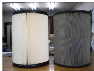
真っ黒で汚れが取れない状態（交換が必要です）