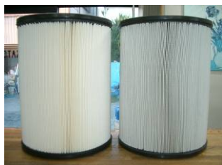
通常の清掃で十分な状態